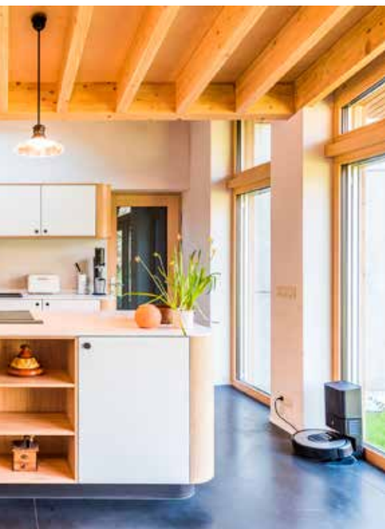
Meubles Atelier Timmerwerkt fabrique meubles et cuisines sur mesure pour ces clients.

« Oui, c'est comparable, mais nous ne bénéficions pas de subventions structurelles pour mener à bien nos activités. Il n'y a pas de différence entre une entreprise 'ordinaire' et nous. C'est un véritable défi, c'est certain. En fait, chaque entreprise devrait ressembler un peu à Timmerwerkt. Si chaque entreprise offrait une chance à deux profils du même type, il n'y aurait plus aucun